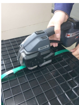
バンドを重ね、結束機を ワンタッチでセット