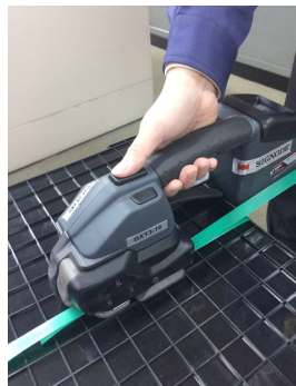
引締めボタンで引き締め