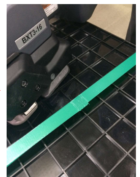
LEDが光って完了表示